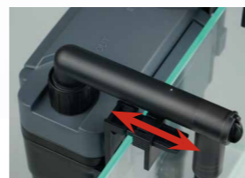
Клипсы-струбцины для крепления на стекло