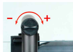
Плавная регулировка потока