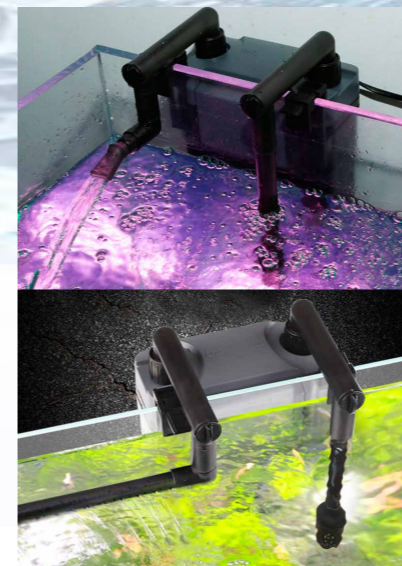
На выходной патрубок можно установить насадку-«флейту», либо насадку типа сопло