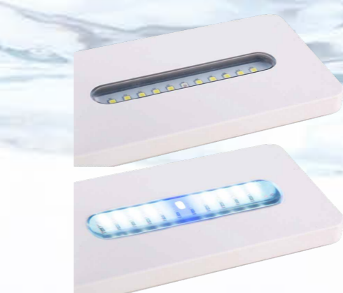
10 белых и 1 синий светодиод

Подвижный кронштейн световой панели легко откидывается на 90 градусов для обслуживания аквариума