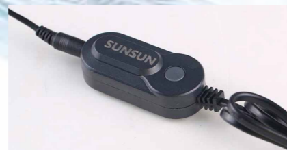
Внешний выключатель питания