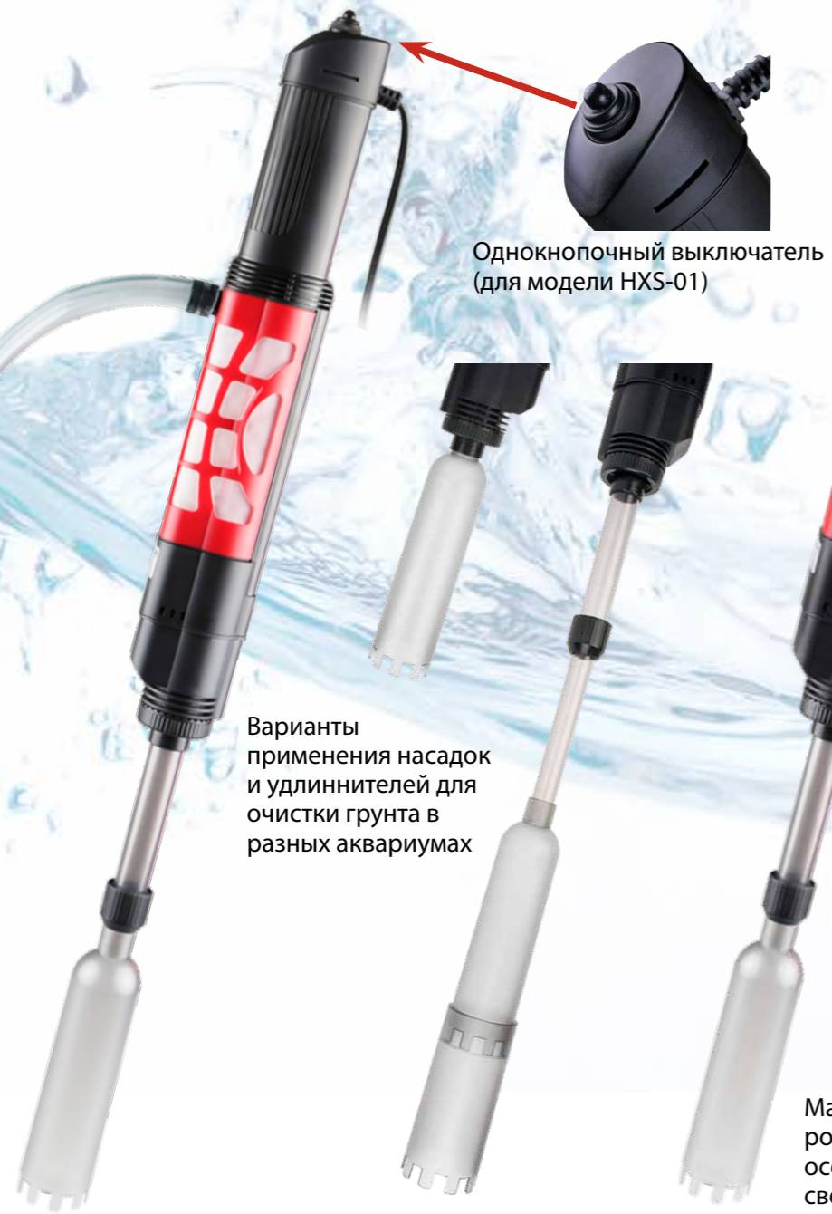
Однокнопочный выключатель (для модели HXS-01)