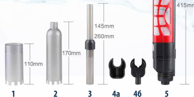
Можно чистить любой грунт или пустое стеклянное дно, применяя разные насадки