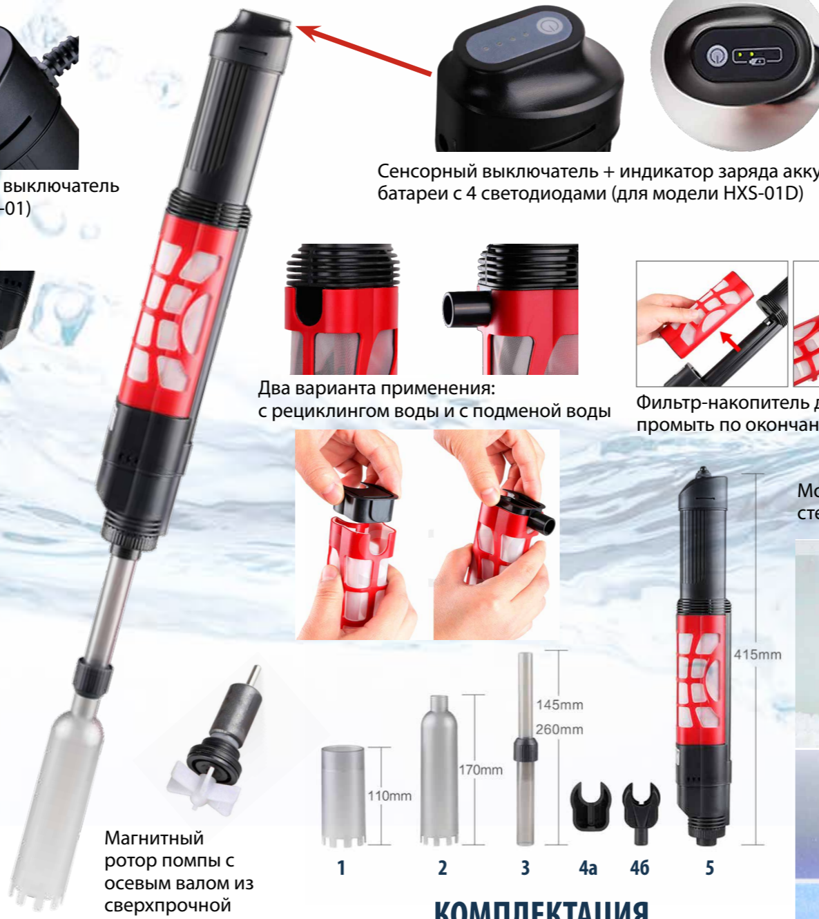
Сенсорный выключатель + индикатор заряда аккумуляторной батареи с 4 светодиодами (для модели HXS-01D)