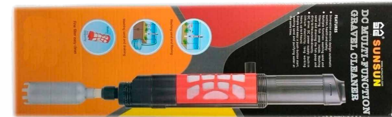
Яркая розничная упаковка

МНОГОФУНКЦИОНАЛЬНЫЕ ЭЛЕКТРИЧЕСКИЕ СИФОНЫ ДЛЯ ОЧИСТКИ АКВАРИУМНОГО ГРУНТА И ПОДМЕНЫ ВОДЫ